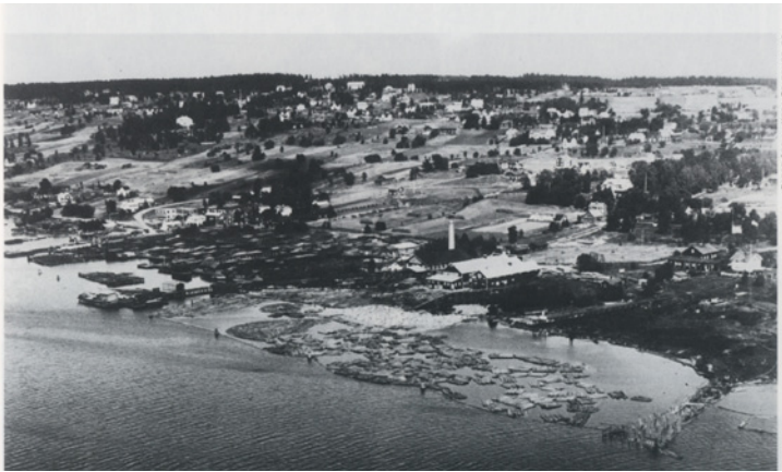
Flygbild över Alvikssågen 1936